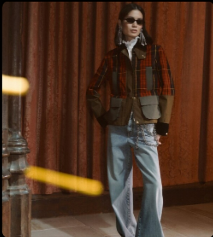
多材质拼布/苏格兰格纹