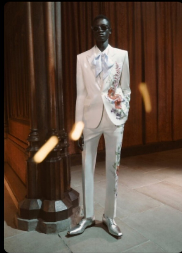
线性延展植物纹理