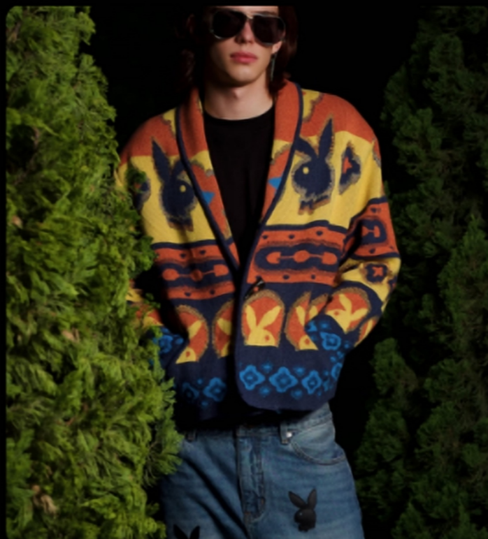
怀旧像素/边缘粗颗粒