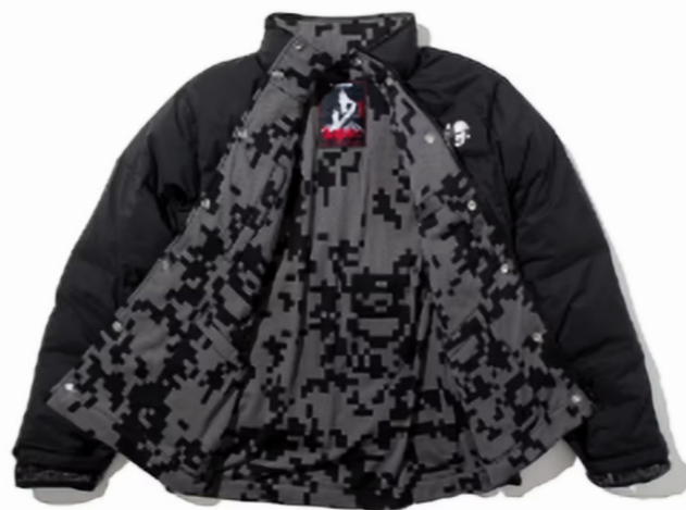
内层装饰/灰黑像素迷彩