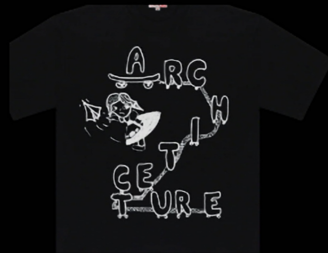
手绘字母/滑板轨迹