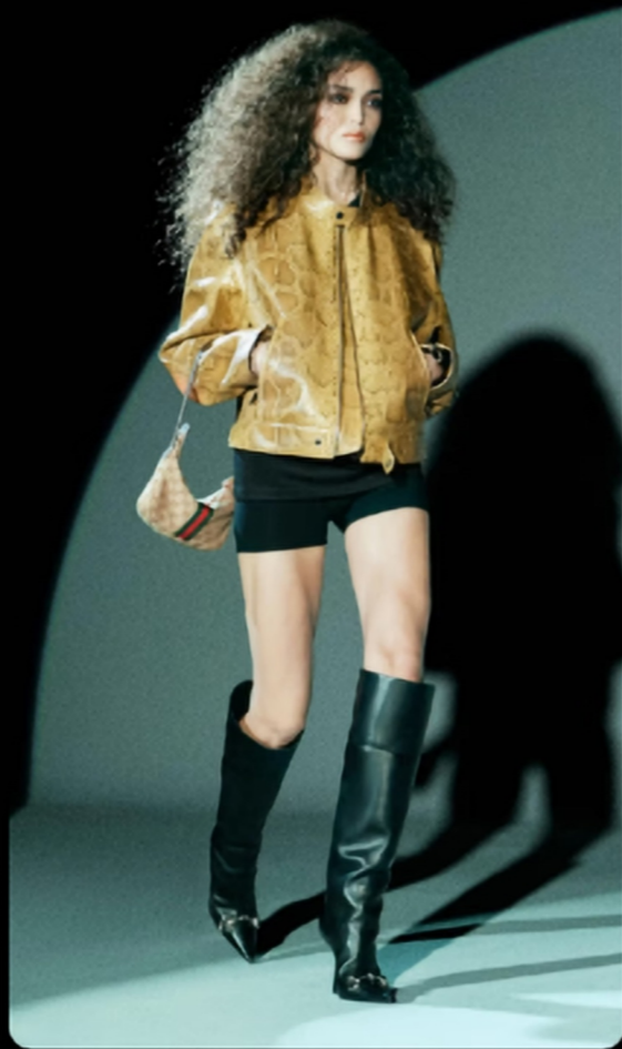
蛇纹/高光涂层皮革