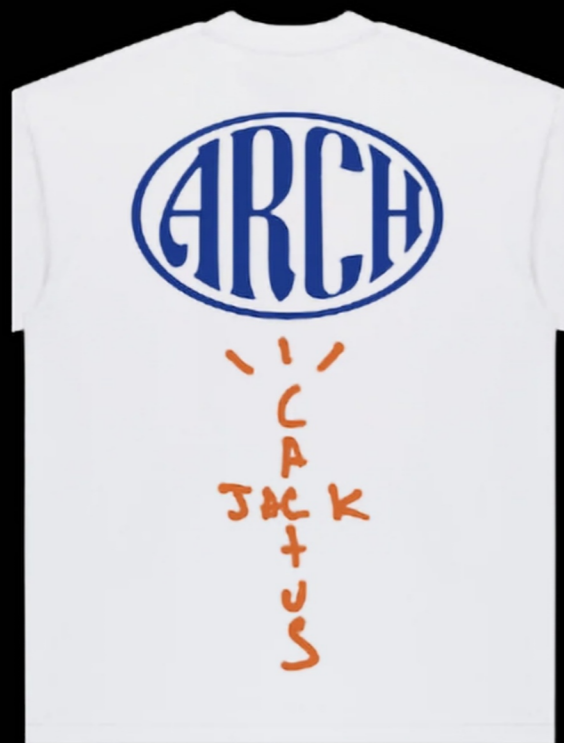
双字体组合/随性手写