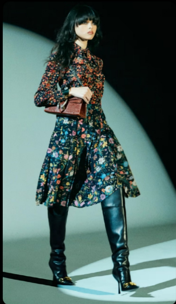
密集碎花/夜幕浪漫

呼应TomFord主导90年代Gucci的氛围，这次2026秋冬经典Gucci 图案，包括源自佛罗伦斯传承的花卉元素，都被明显收敛处理。数款轻盈连身裙印上70至80年代 Gucci 的繁复图腾，醒目的蛇纹、豹纹等动物印花。