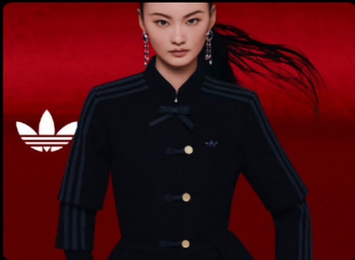
暗纹三杠/金属圆扣