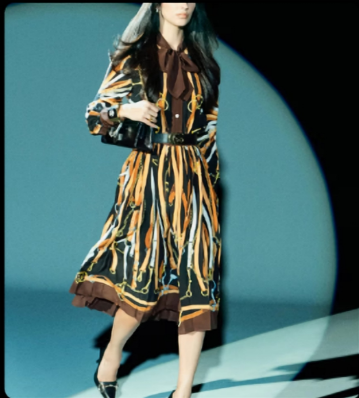
马衔链条/丝巾元素