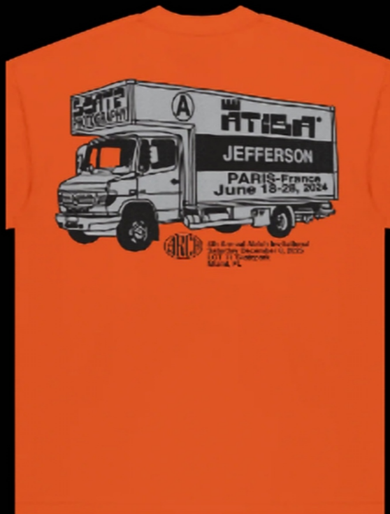
黑灰双色印刷/工业感