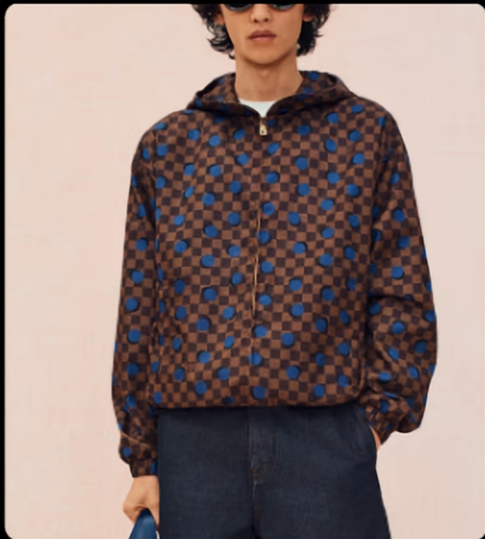
像素棋盘格/偏移波点