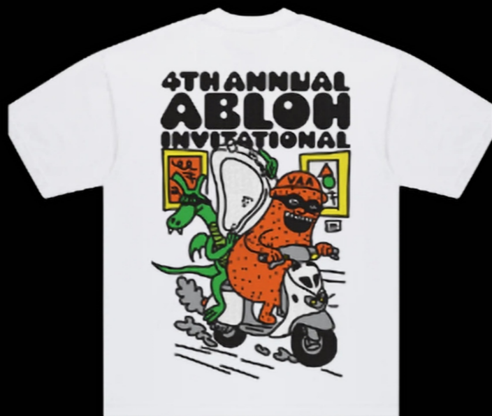
粗线勾勒/街头漫画