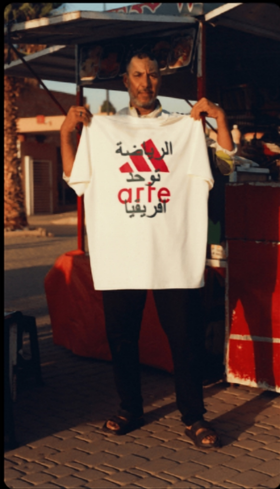
阿拉伯文/文化融合